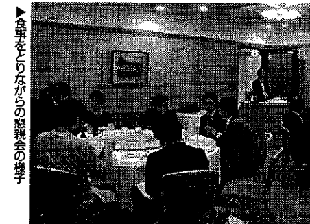
▶食事をとりながらの懇親会の様子

は、現在の経済状況や不動産価格の動向などを解説した上で、下落局面のいまが投資のチャンスであること、キャッシュフローを重視し長期の借入が重要であること、などを説明した。