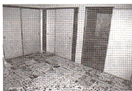
▲長期間の空室で無残な部屋に