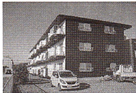
▲印象に残るツートンカラー

なるべくコストをか けないことを意識し た。フローリングを張 り替えると金額がかさ むため、クッションフ ロアを張った。その代 り、流行の板幅の広い オフホワイトに変え た。クロスも塗り壁風