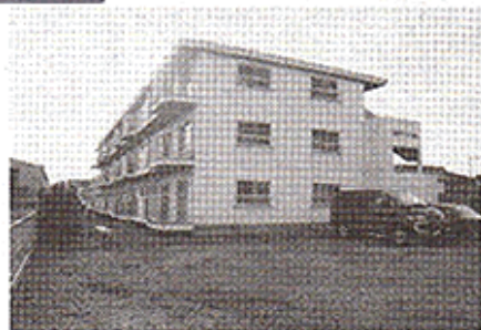
▲薄汚れた壁築年数の古さを感じる